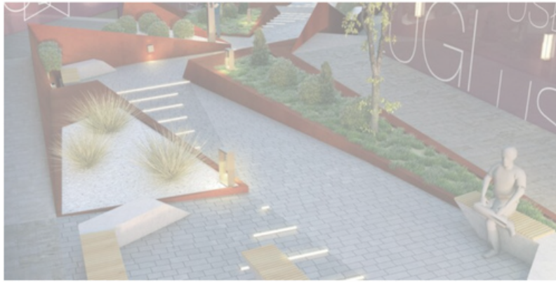
Kielce. „Trójkąt bermudzki” - wizualizacja / mat.prasowe