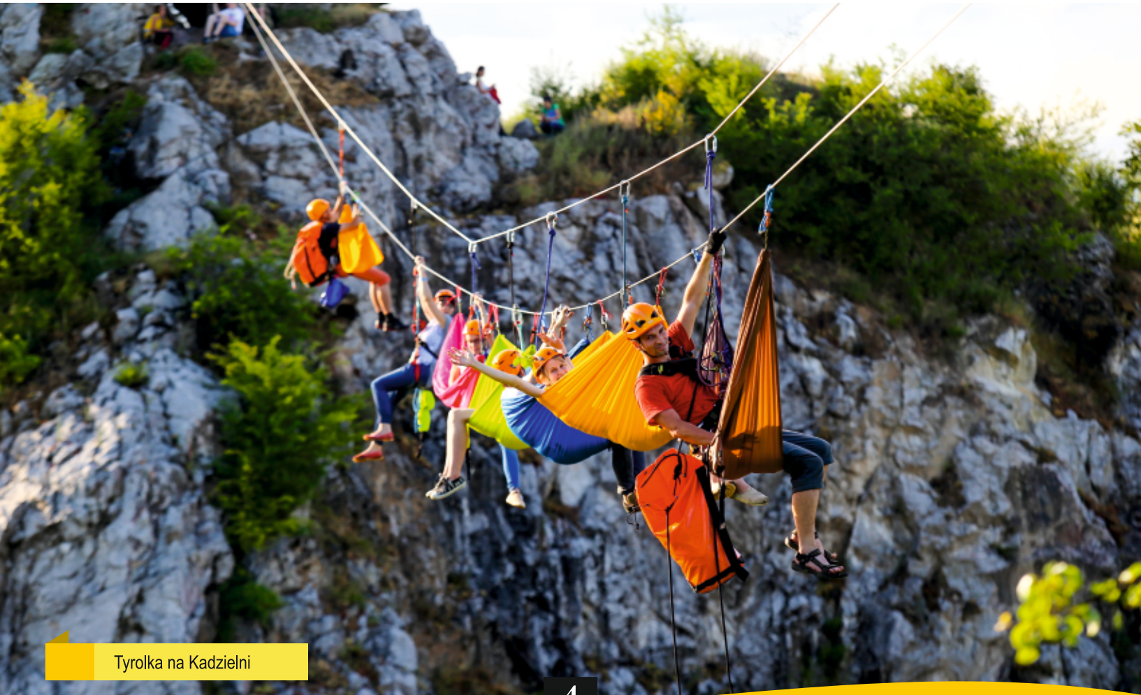
Tyrolka na Kadzielni

Do dyspozycji aktywnych turystów jest sieć szlaków pieszych i rowerowych oraz ścieżek edukacyjnych. Szczególnie polecamy "Tour de Kielce", czyli 59-kilometrowy szlak żółty, dzięki któremu warto poznać miasto z każdej strony. W Kielcach aktywną przygodę na łonie natury można połączyć ze zdobywaniem wiedzy, a wszystko dzięki tablicom edukacyjnym lub zwiedzaniu miasta ze świętokrzyskim przewodnikiem.