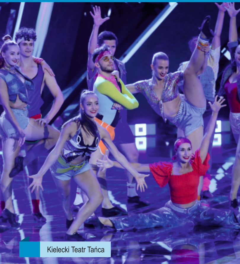
Kielecki Teatr Tańca