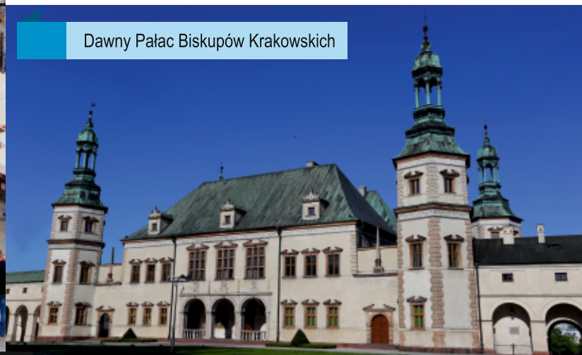
Dawny Pałac Biskupów Krakowskich