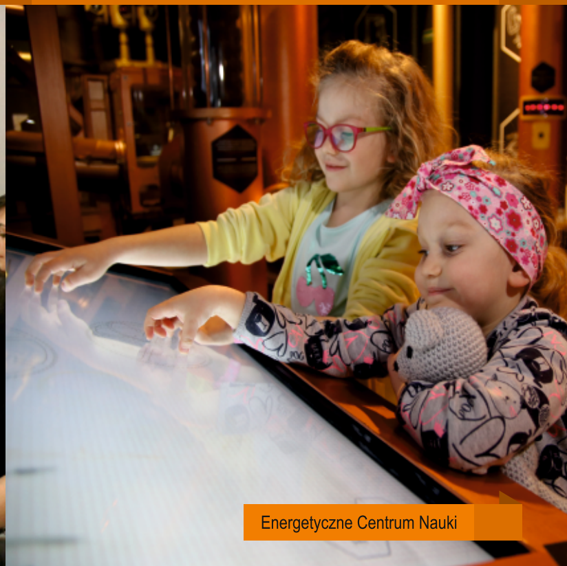
Energetyczne Centrum Nauki