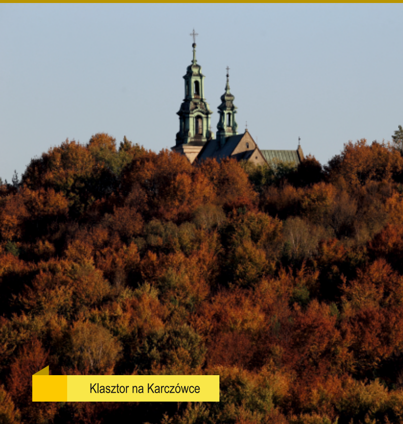
Klasztor na Karczówce