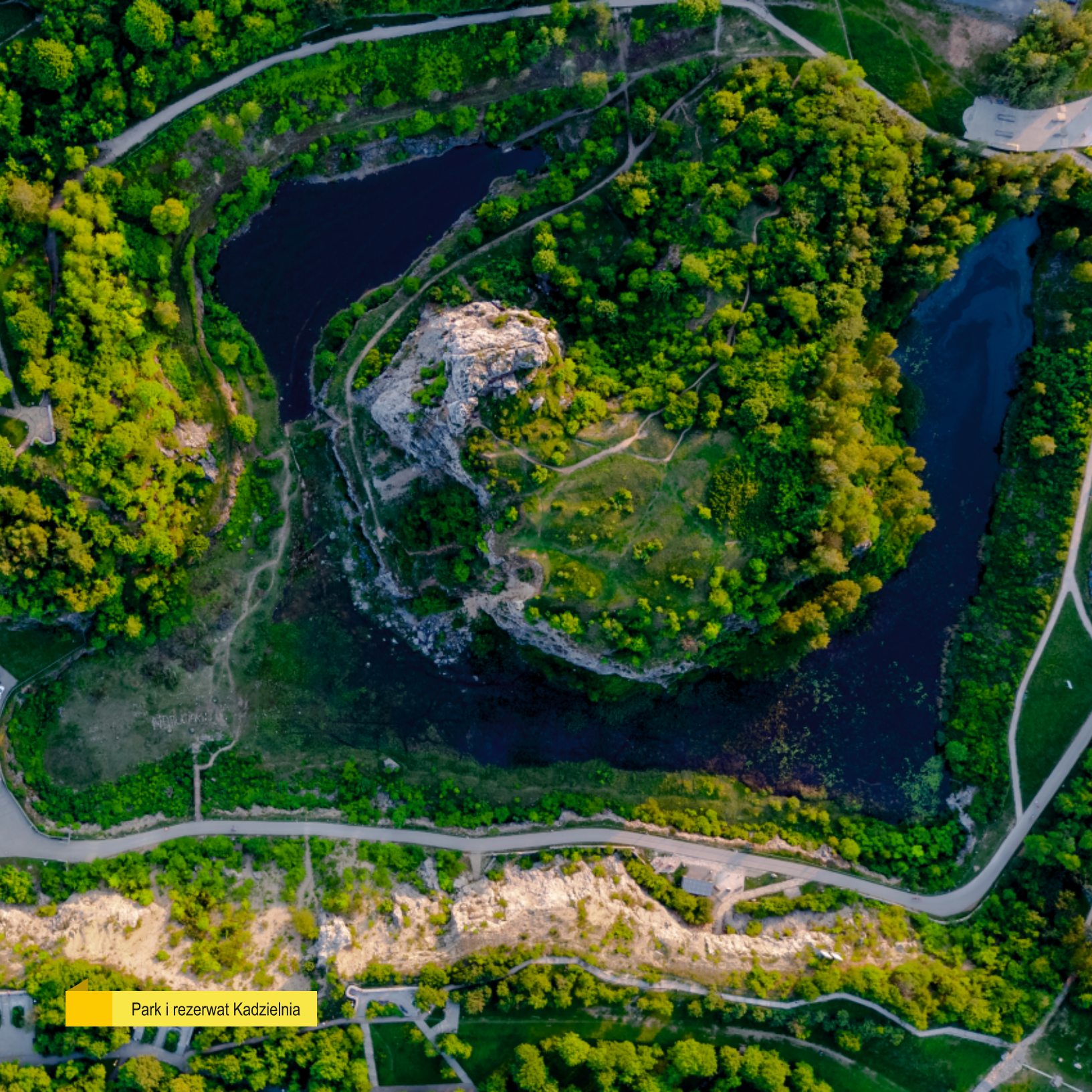
Park i rezerwat Kadzielnia