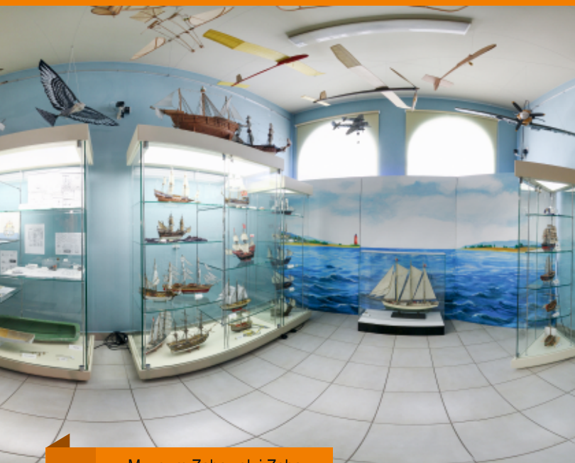
Muzeum Zabawek i Zabawy

11.00 Spacer po Kadzielni, geologicznym skarbie Kielc, możliwość zwiedzania jaskiń.