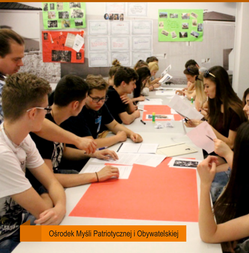
Ośrodek Myśli Patriotycznej i Obywatelskiej