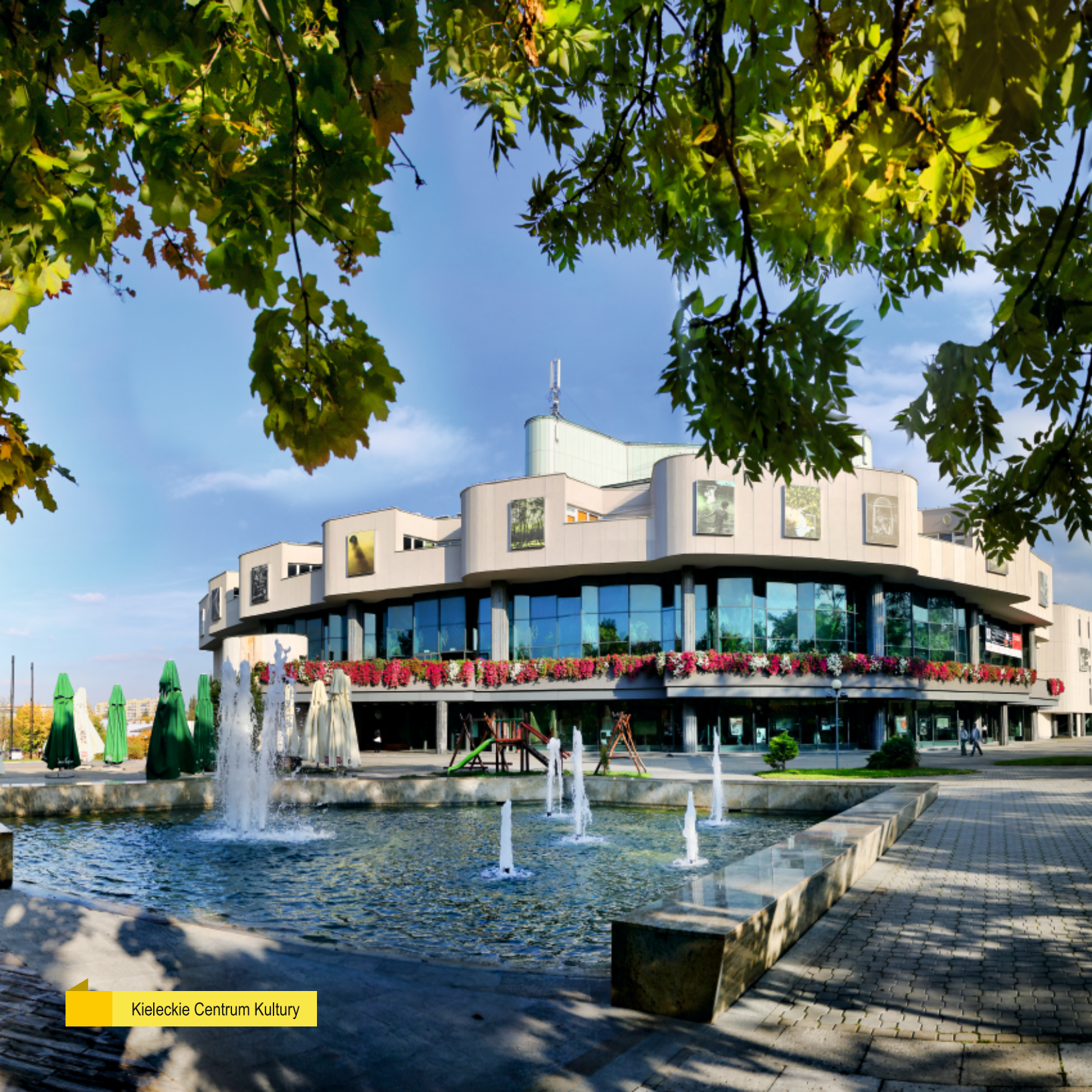
Kieleckie Centrum Kultury