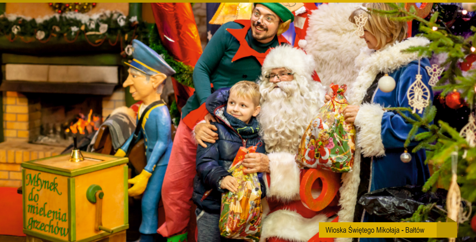
Wioska Świętego Mikołaja - Bałtów