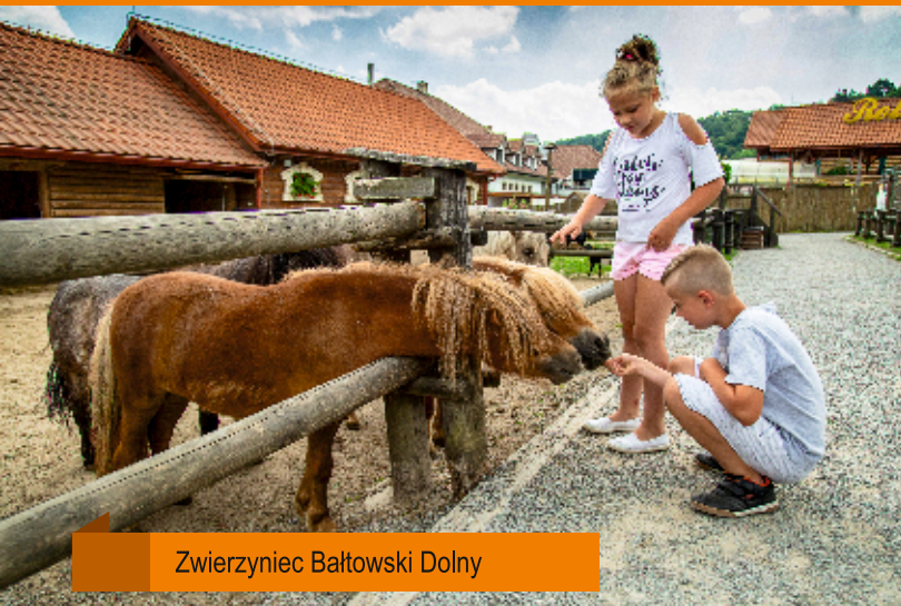
Zwierzyniec Bałtowski Dolny