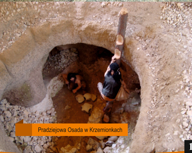
Pradziejowa Osada w Krzemionkach