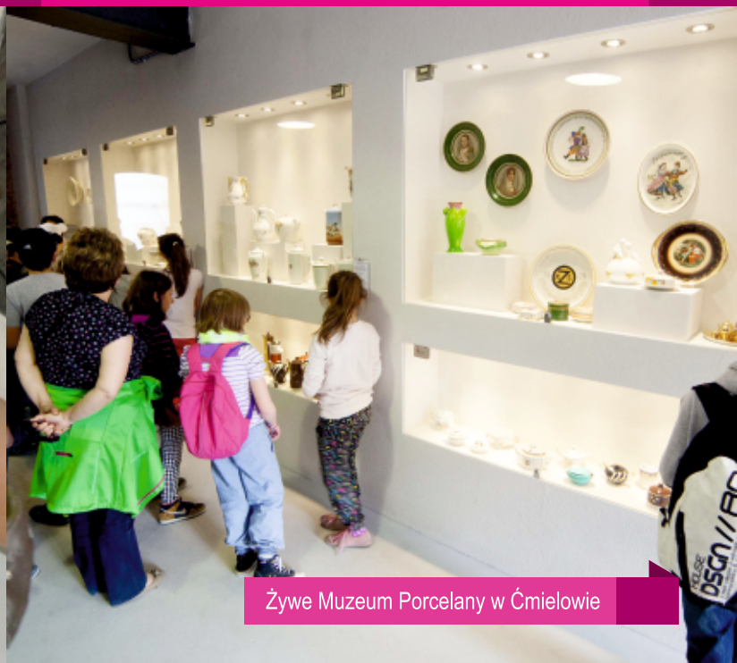
Żywe Muzeum Porcelany w Ćmielowie