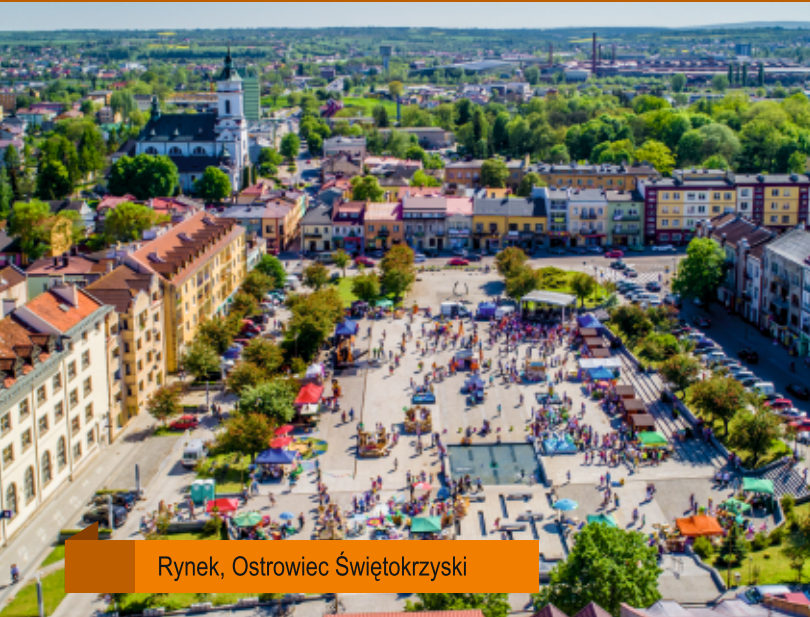
Rynek, Ostrowiec Świętokrzyski