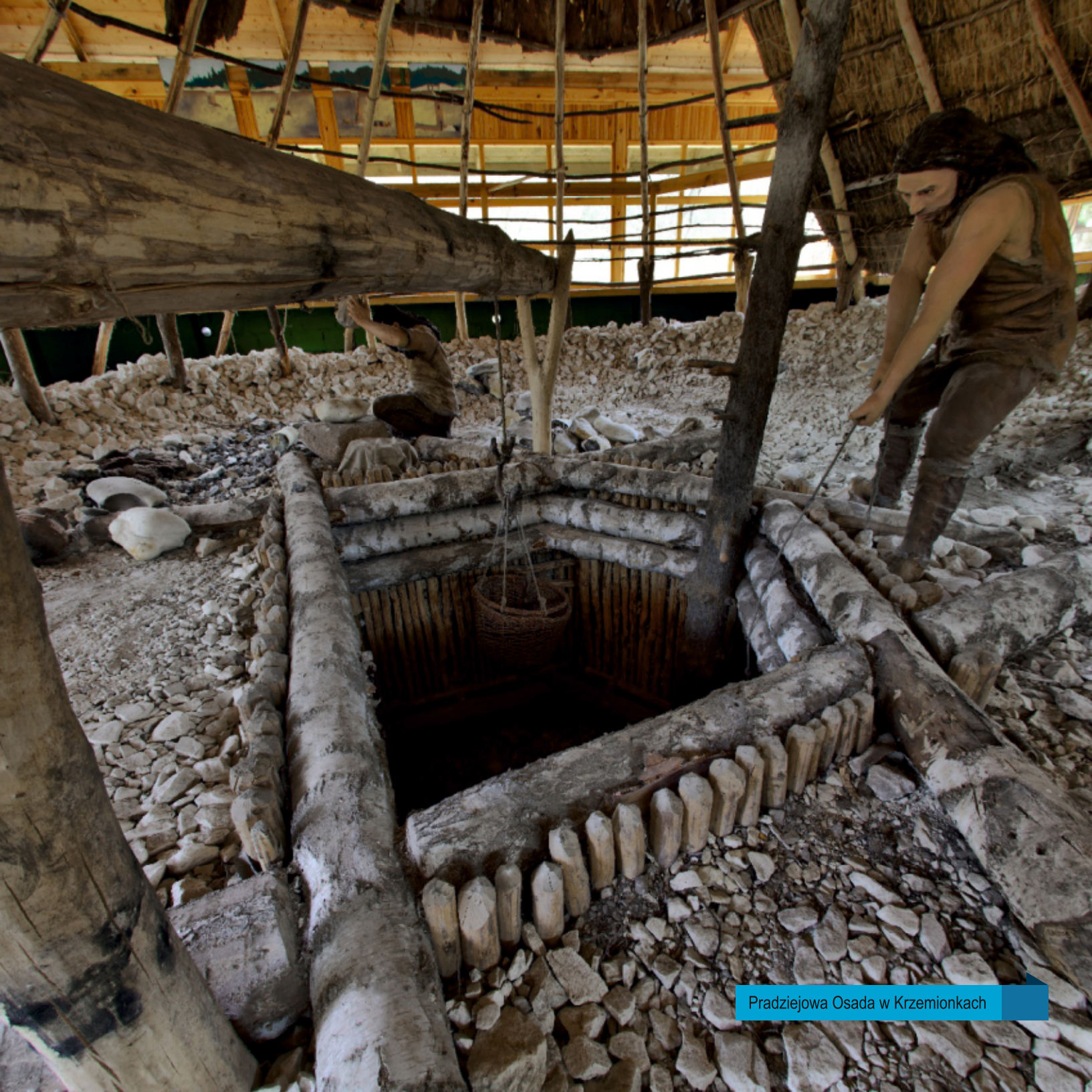
Pradziejowa Osada w Krzemionkach