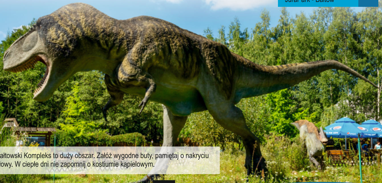
JuraPark - Bałtów

Bałtowski Kompleks Turystyczny stanowi doskonałe miejsce do relaksu i wypoczynku. Sam kompleks zajmuje obszar ponad 100 hektarów. Jego historia rozpoczęła się od budowy pierwszego w Polsce parku dinozaurów - JuraParku, który powstał wkrótce po odkryciu w Bałtowie tropów dinozaurów. Bałtowski Kompleks to również: Muzeum Jurajskie, wioska słowiańska „Sabatówka”, Gondwana - plac zabaw kreatywnych, Pasięka Edukacyjna i Kraina Koni. Dinomaniacy będą zachwyceni oglądając autentyczne tropy dinozaurów w Żydowskim Jarze lub na skale zwanej Czarcią Stopką.